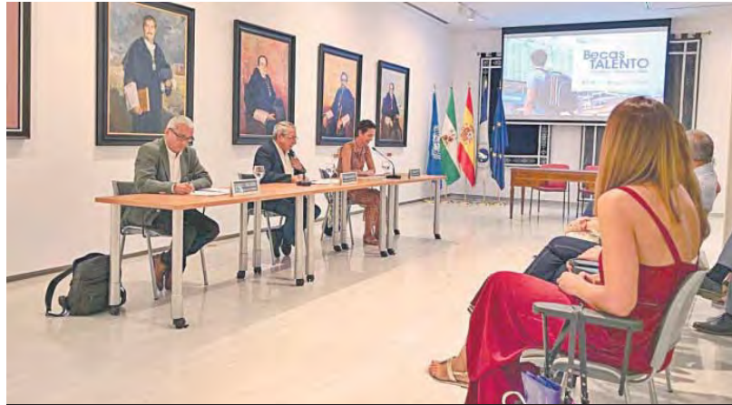
Presentación de las becas Talento.

De este modo, dos personas, menores de 25 años, que tengan una gran motivación, podrán beneficiarse de esta ayuda en el curso académico 2024-25 y obtener hasta 45.000 euros anuales para desarrollar el máster que elija.