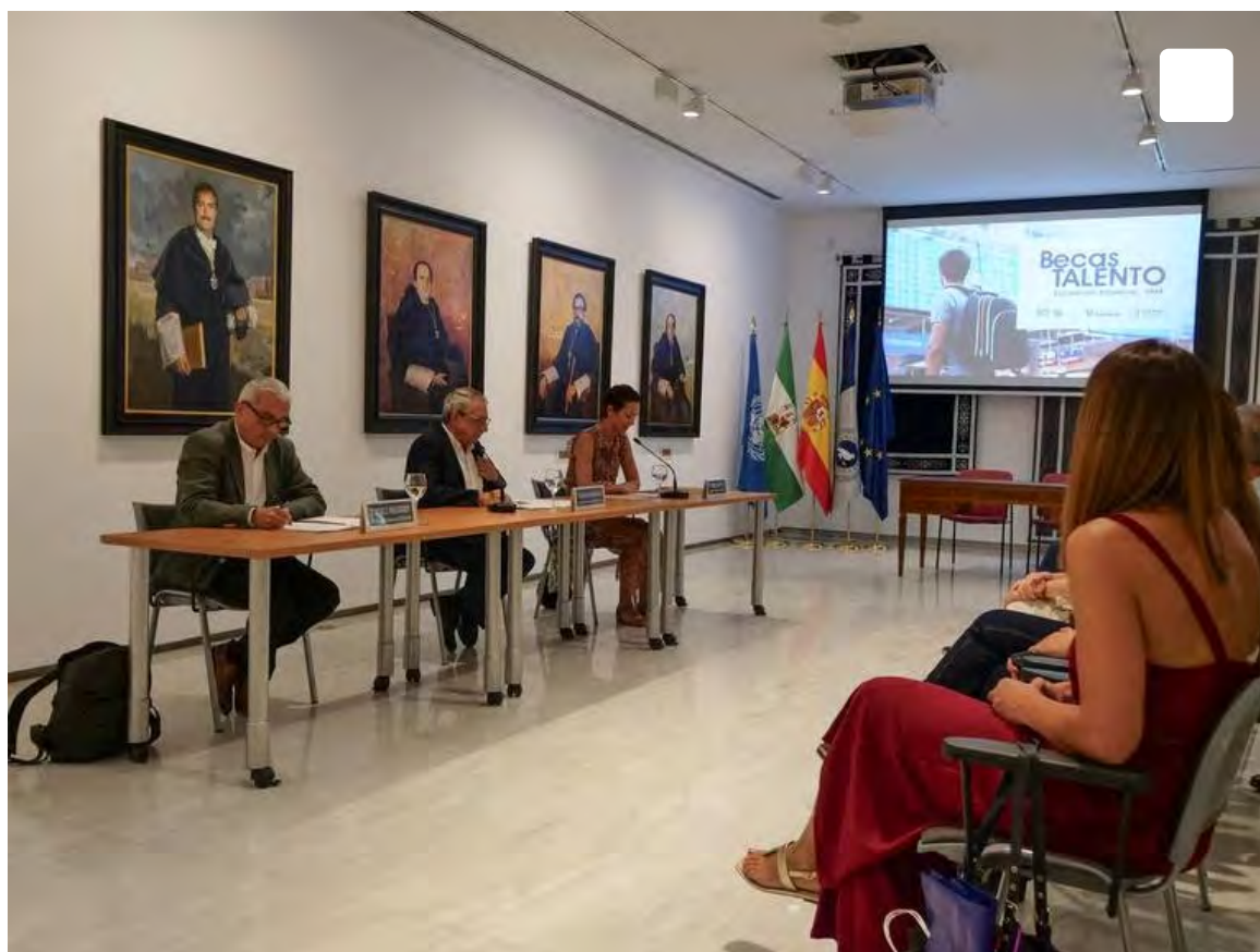
Becas Talento / UMA

Pueden solicitarse hasta el próximo 29 de septiembre