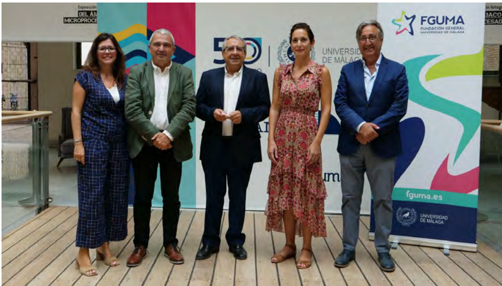
Presentación Becas Talento.