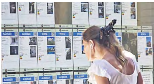
Una persona consulta los precios de una inmobiliaria.

Podrán solicitar las Becas Talento, hasta el 29 de septiembre, aquellas personas que estén en posesión de título superior (grado universitario, licenciatura o máster) expedido por la Universidad de Málaga, o personas que se encuentren en su último año durante el curso académico 2023-2024 en la UMA.